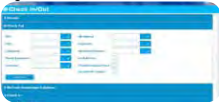
“Check-In” de AMT Mobile

AMT Mobile es un nuevo módulo de AMT que corre en un Tablet PC. Permite a los usuarios “descargar” los datos de AMT y trabajar fuera de línea, para luego después hacer el ingreso de datos.